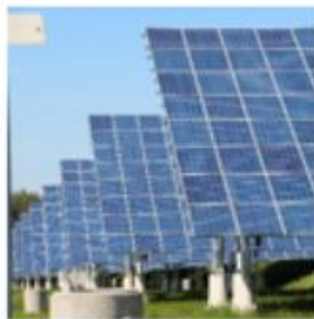
Zon op land