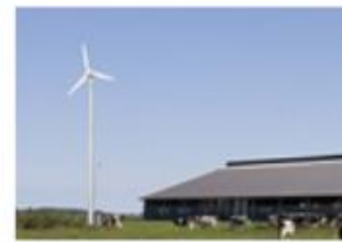
Wind bij boer 25 m