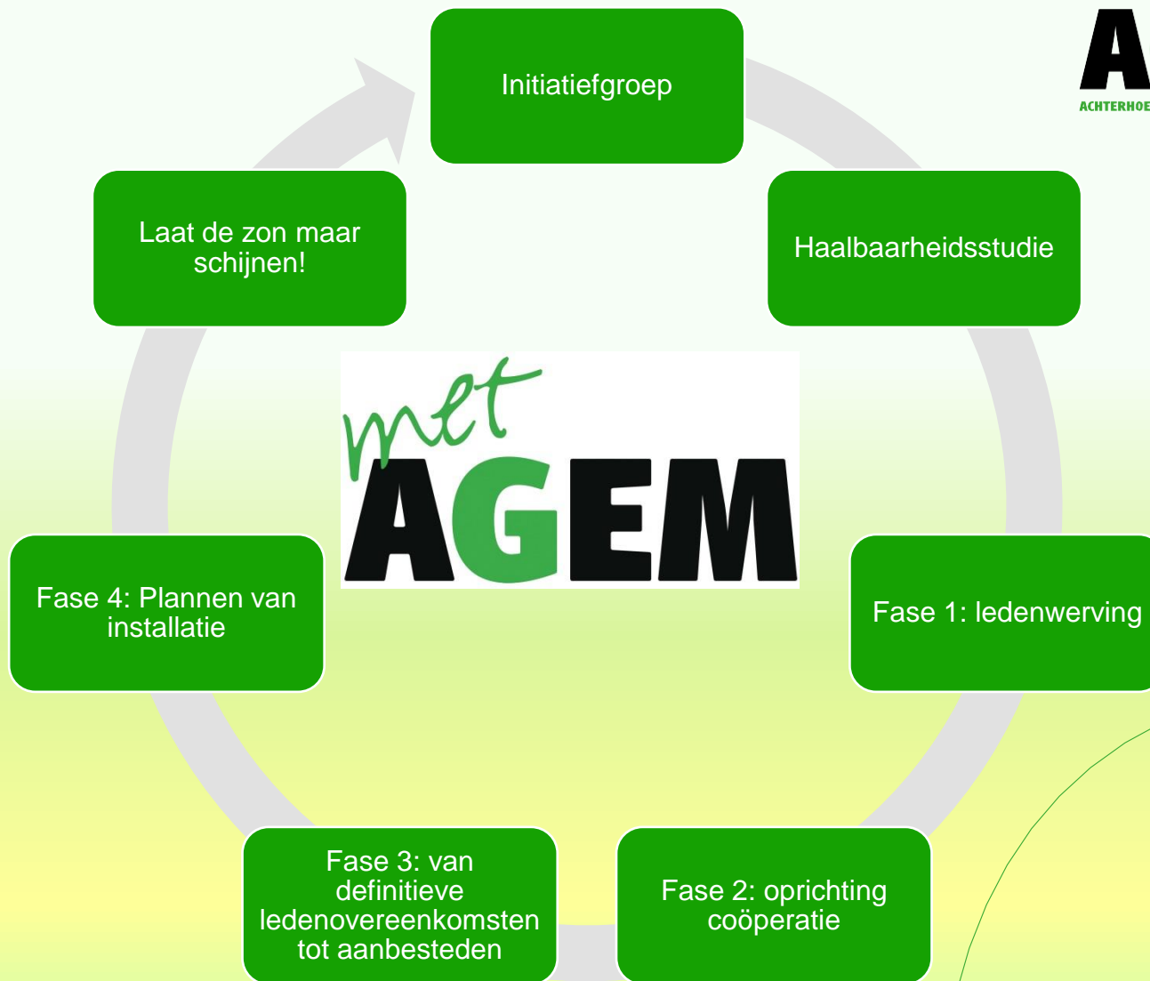
Figuur 2. De postcoderoos, een circulair project