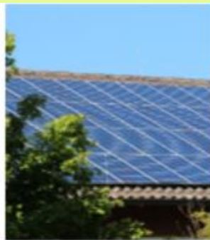
Zon op dak