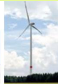
Wind op land 150 meter