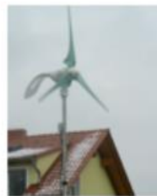
Wind op dak