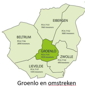
Groenlo en omstreken

Zet het alvast in uw agenda. Gebruik uw stem en praat mee.